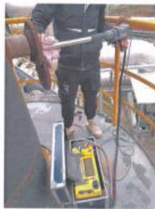
研发室排气筒出口 04#