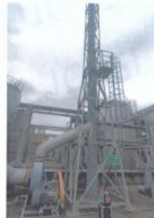
罐区一排气筒出口 05#